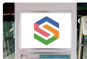
運転台背面 B3ポスターシングル