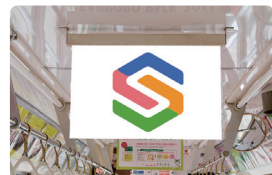
中ぶり B3ポスターシングル