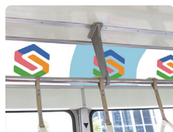
まど上 B3ポスターシングル