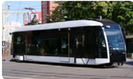
札幌市電 1100形 低床車両 シリウス

この度、企業の皆様で広告を考えていらっしゃる方、一般市民の皆様でシリウスが好きな方・街の景観に意識の高い方と共に、屋外広告のあり方を考えたいとの思いからデザインコンテストを企画しました。奮ってご応募ください。