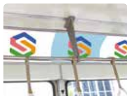
まど上 B3ポスターシングル