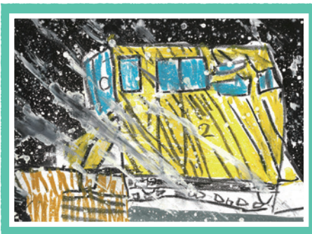
小学生低学年の部