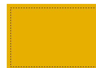
B3 ポスターシングル (H364mm×W515mm)

※運転台背面は上下左右ともに20mmの 余白が必要。素材は135kgコート紙推奨