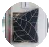
パンフレットケース